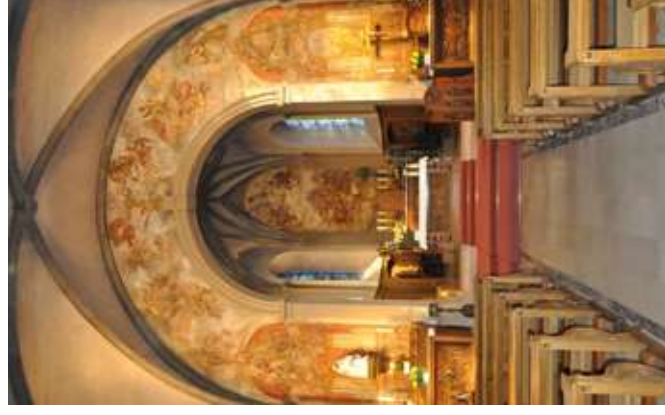
Sehenswert in Dalheim ist ebenfalls die Kirche Sankt Peter und Sankt Paul mit den Fresken von J.G. Weiser aus der 2ten Hälfte des 18. Jahrhunderts. L'église St. Pierre et St. Paul où se trouvent les fresques de J.G. Weiser du 18ème siècle vaut le détour.