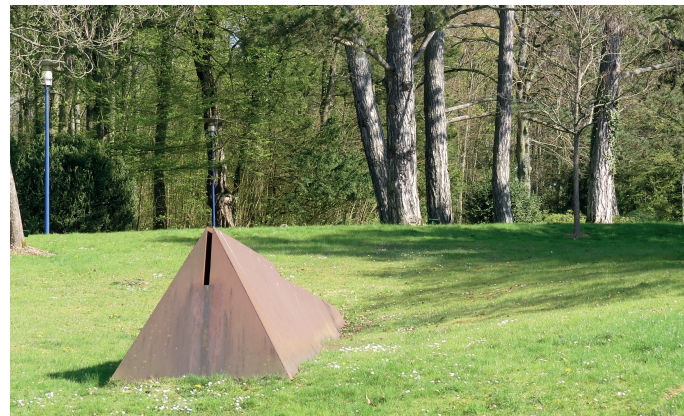
Oeuvre de Pit NICOLAS