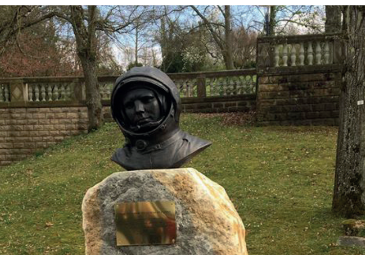
Buste du cosmonaute Youri GAGARIN (Alexey D. LEONOV)