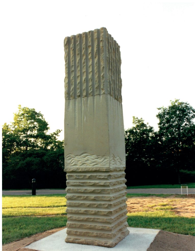
Aqua fons vitae, 1968 (Tom FLICK)