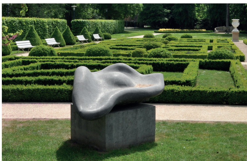
Nata Nel mare (Daniele BRAGONI)