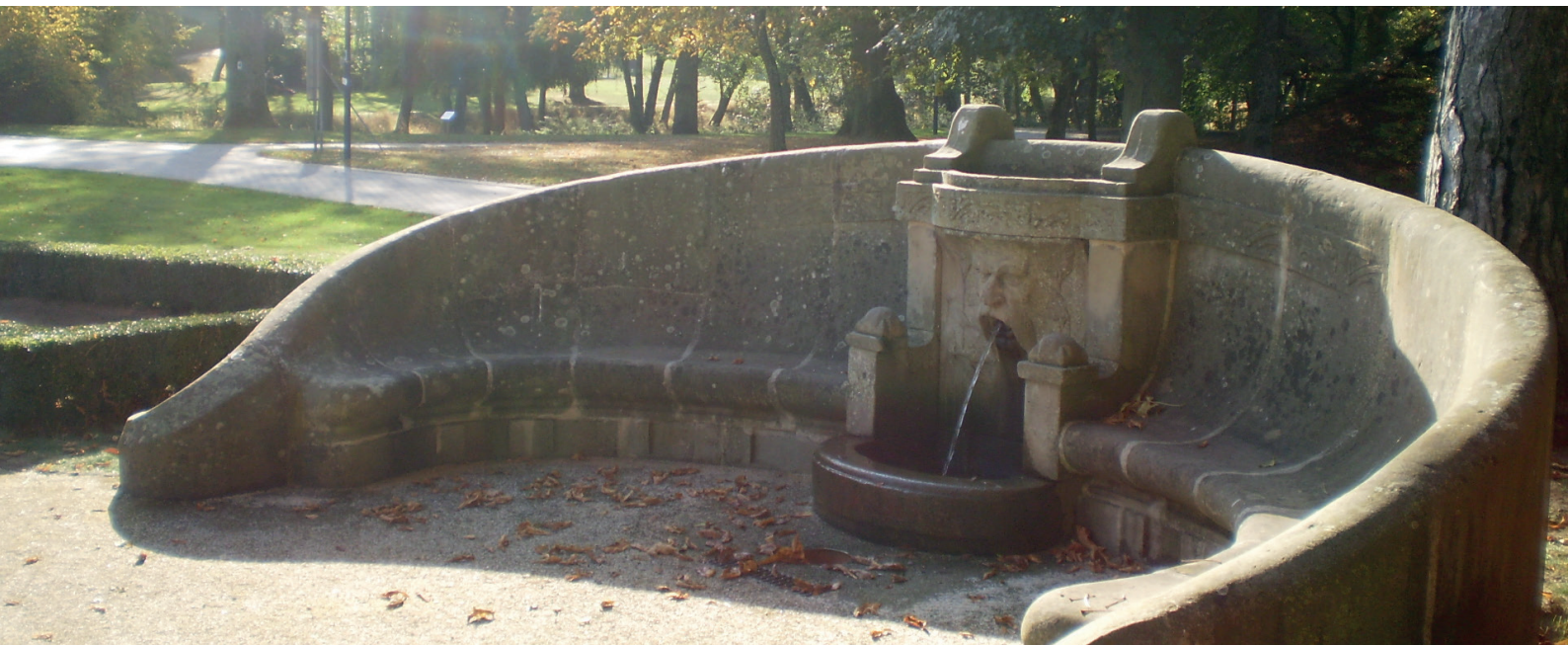
Le Cracheur Banc en pierre avec abreuvoir à oiseaux