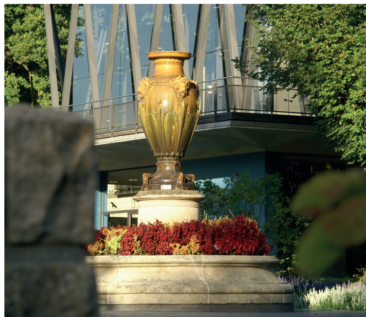
Majolika Vase, en terre cuite (Atelier Villeroy & Boch pour l'exposition universelle de 1900 à Paris, cadeau du ministre d'Etat Paul Eyschen)