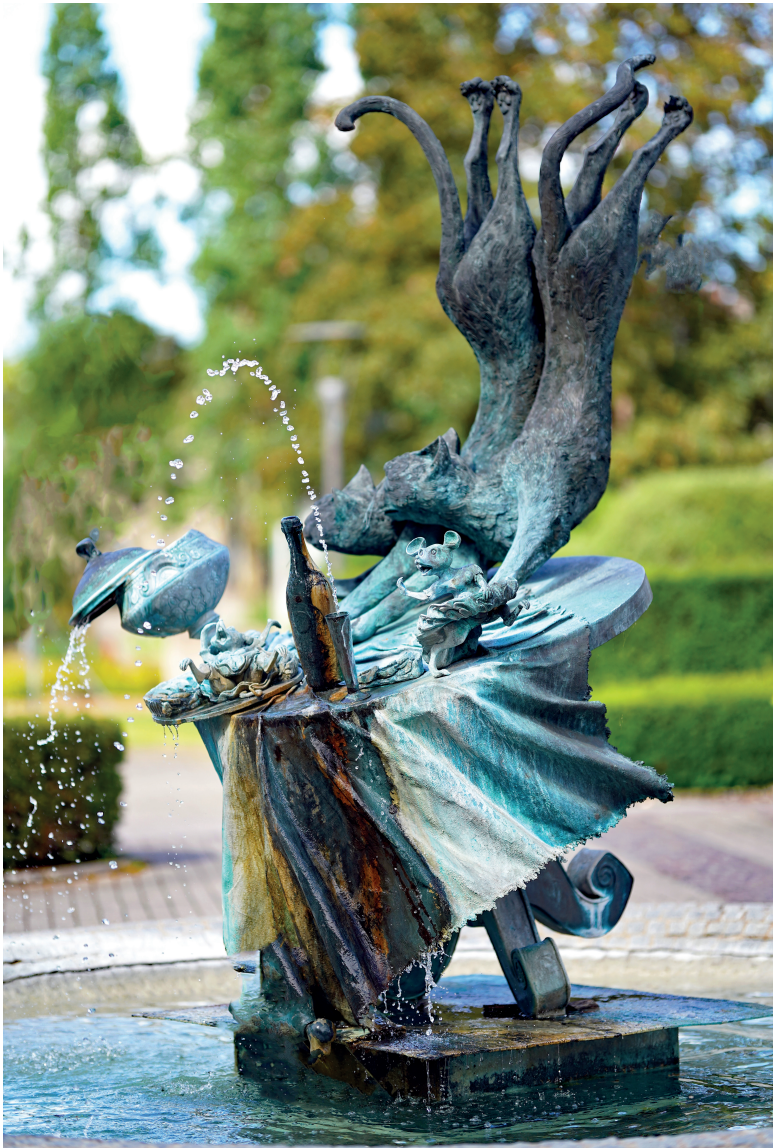
Fontaine Maus Kätti, 1987 (Wil LOFY)