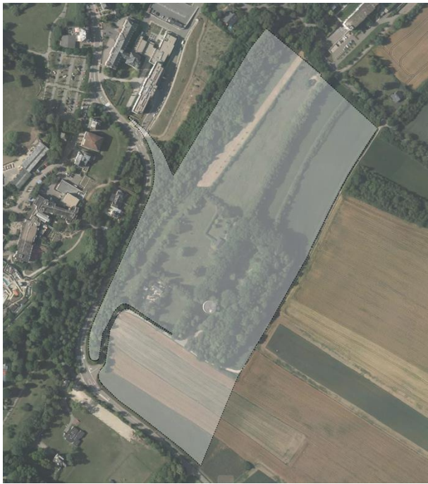
SCHÉMA DIRECTEUR M-NQ5 ZAD – Am Klengen Park