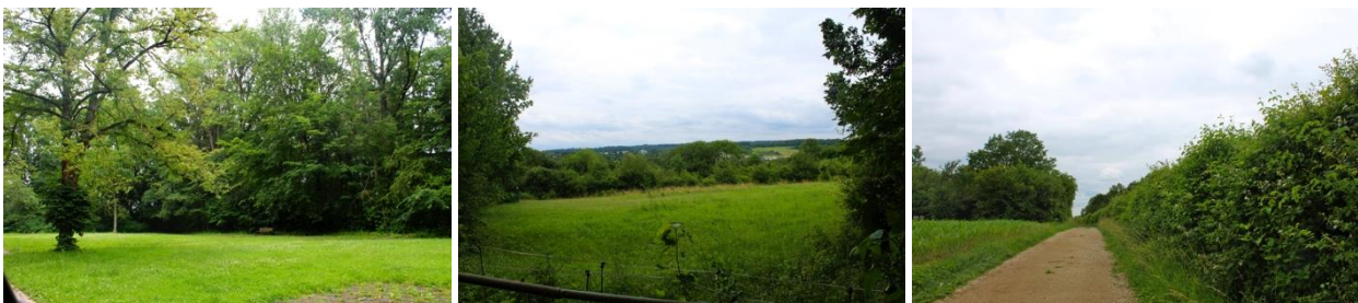
Intérieur du site