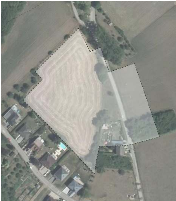
SCHÉMA DIRECTEUR A-NQ3 ZAD – Beim Houbur