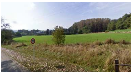
Site, vue vers le sud