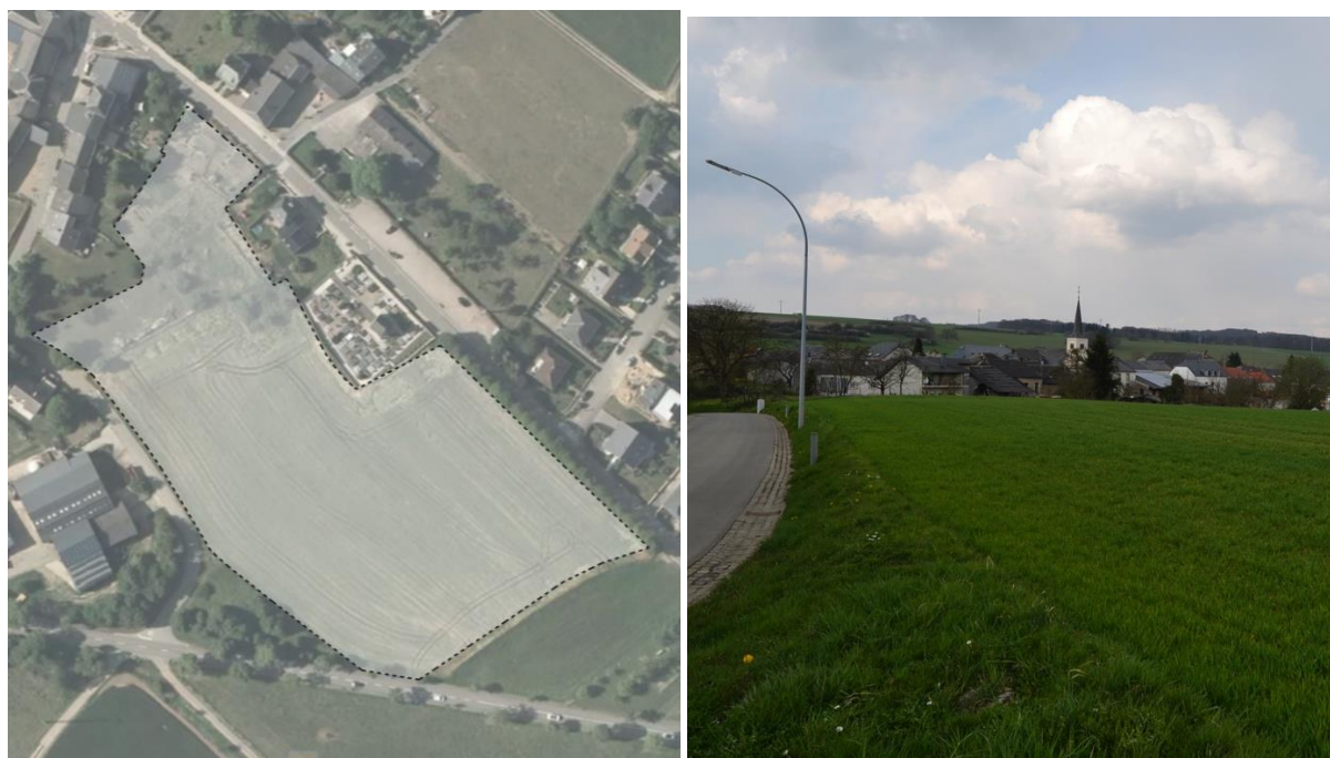
SCHÉMA DIRECTEUR E-NQ3 – Am Kiirchebongert