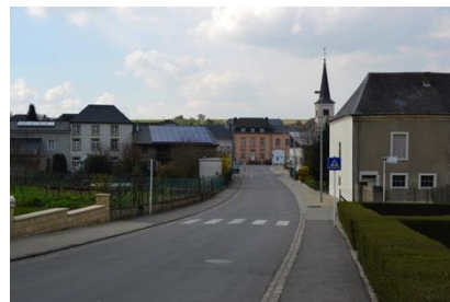
Rue du Cimetière – Vue vers le centre depuis l'ouest du site