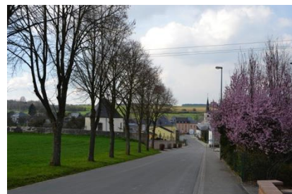
Alignement d'arbres à conserver, rue du Cimetière