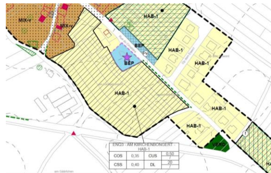
Extrait de la partie graphique du PAG