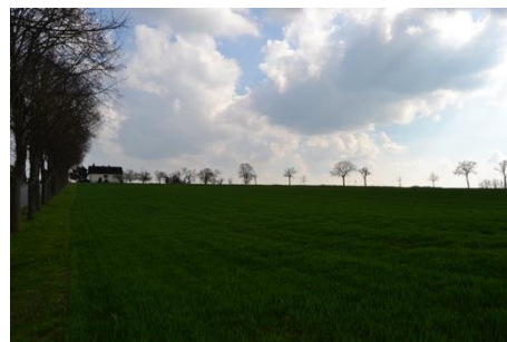
Vue depuis la rue du Cimetière