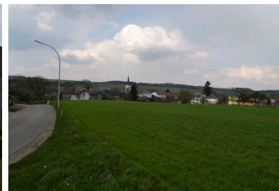
Rue de l'Eau