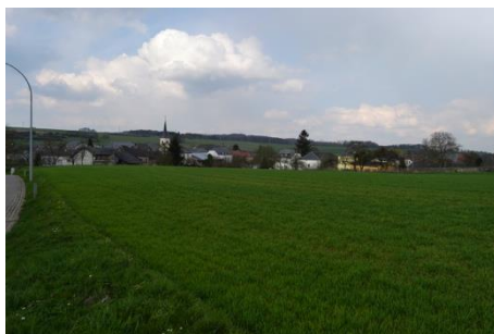
Vue depuis la rue de l'Eau