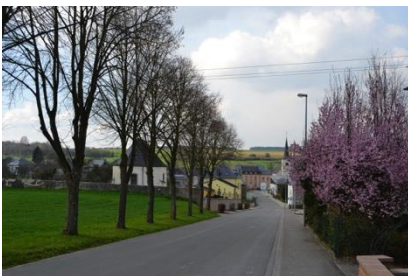
Rue du Cimetière – Vue vers le centre depuis l'est du site